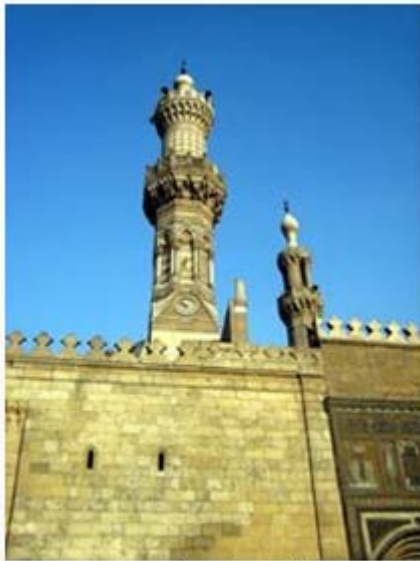
Der Film möchte die Vielfalt des Islams vermitteln und die Zuschauer zum Nachdenken anregen.

Vor allem die Spiritualität, die immer wieder akzentuiert worden ist, ebenso wie die mystische Komponente des Islam habe ihm sehr imponiert, so der Islamwissenschaftler. "Und es ist traurig, dass eben dieser Islam, diese Strömung, die ja über 90 Prozent der Muslime repräsentiert, in den öffentlichen Debatten überhaupt nicht wahrgenommen wird."